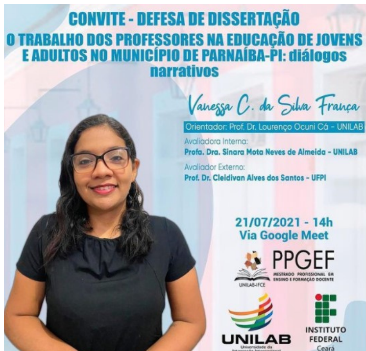
Convite defesa de dissertação.